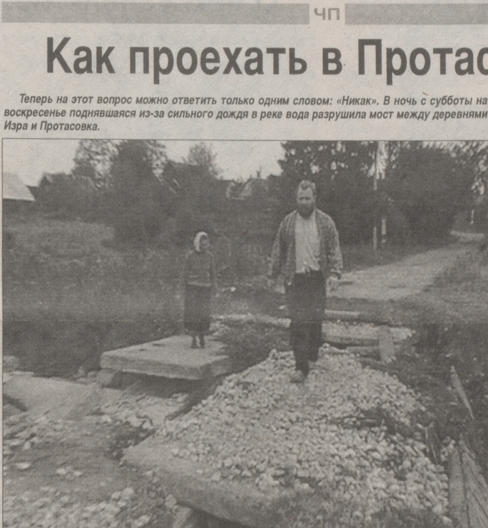
Теперь на этот вопрос можно ответить только одним словом: «Никак». В ночь с субботы на воскресенье поднявшаяся из-за сильного дождя в реке вода разрушила мост между деревнями Изра и Протасовка.